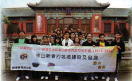
本校師生在新會學宮門外留影