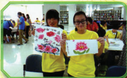
同學學習中國繪畫