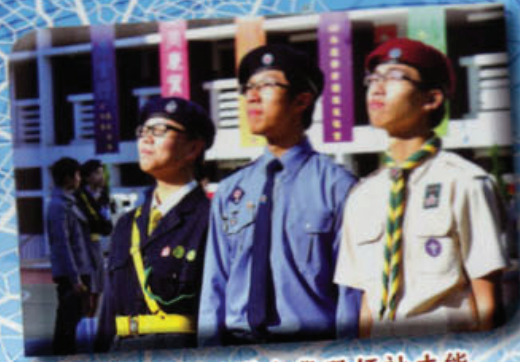
同學制服團隊中學習領袖才能