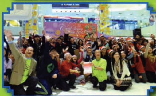
同學們於聖誕節參與社會服務，以歌聲為有需要的人籌款