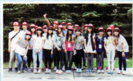
戴上安全頭盔後，準備參觀全中國年產量第三大的武漢鋼鐵廠。