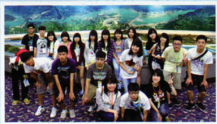
於三峽水利工程展覽館中，同學們獲益良多。