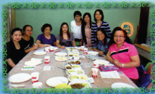
家長和老師為同學定期檢視午膳供應商服務質素