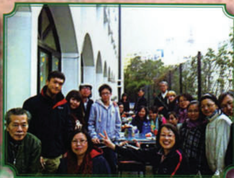
同學和家長們在涼風送爽下，一同燒烤