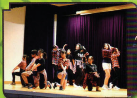
同學於「信義舞台」展示出舞蹈才能