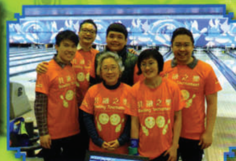
同學參與第四屆共融之樂保齡球賽