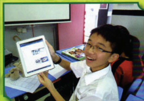
同學以平板電腦於課堂中學習英語