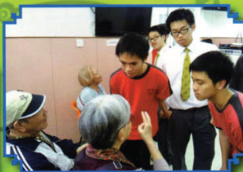
同學在關懷行動中探訪長者