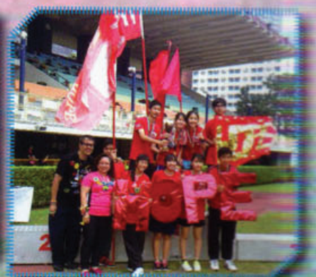
林梁莉莉女士頒獎給望社的學生