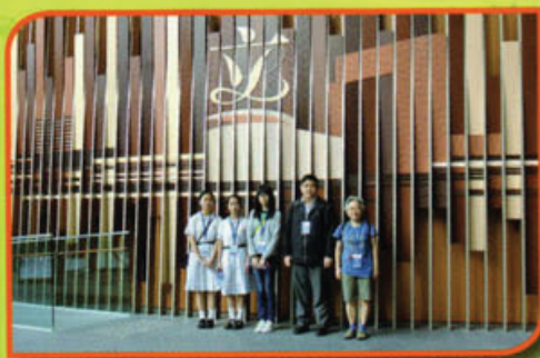
同學參與模擬立法會工作坊