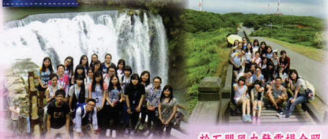
於十分瀑布前合照