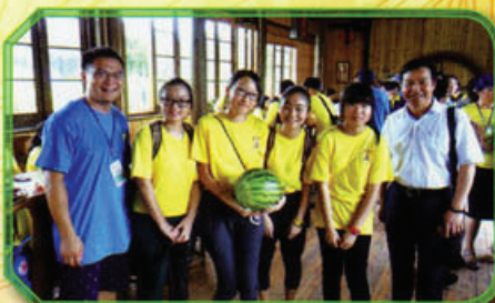
同學到果園體驗摘水果