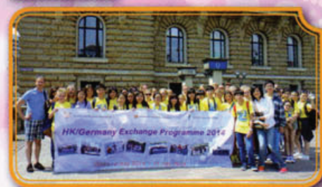
同學到漢堡市政廳參觀