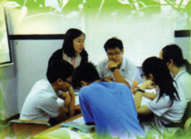
小組合作學習提升學習效能