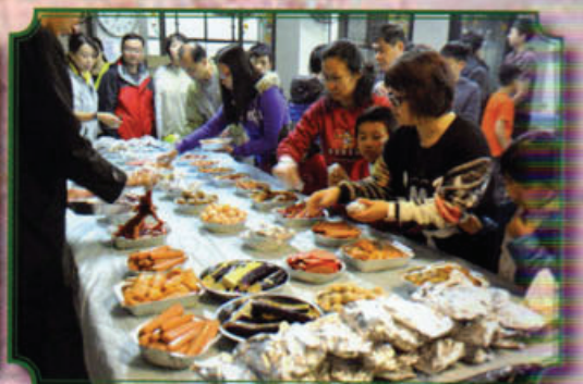
當日預備了豐富美味的食物，大家都盡慶而歸