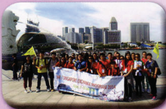
本校與培德書院師生到新加坡著名地標魚尾獅