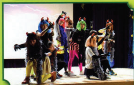
同學透過欣賞及參與英語音樂劇，提升學習英語的興趣