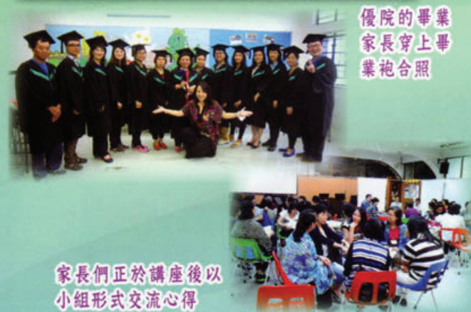
優院的畢業家長穿上畢業袍合照