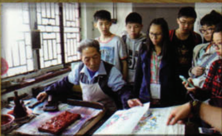
到濰坊參觀中國快將失傳的板畫製作