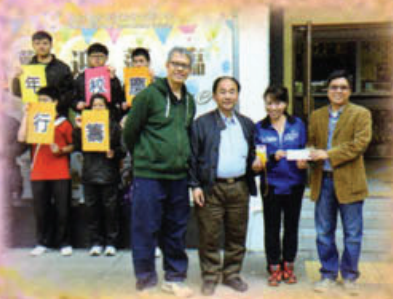
家教會代表參與 55 周年校慶「書友同行」步行籌款