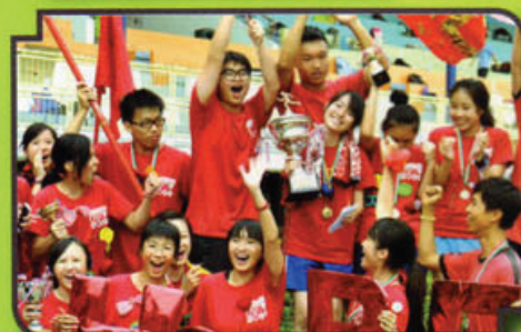
同學於陸運會中收獲豐富