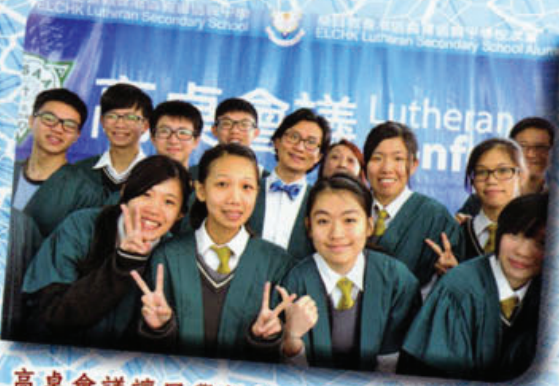
高桌會議讓同學從師兄姊的經驗中學習