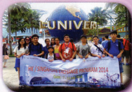
本校師生到新加坡環球影城玩樂