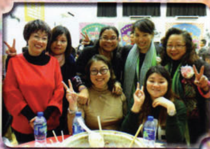
家教會在校慶晚會上與眾師生及校友分享校慶的喜悅