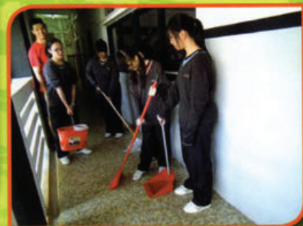
同學在學校身體力行，體驗清潔工作，提升公民意識