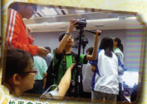
校園電視台到校外體驗採訪工作