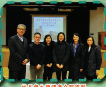
校長與主題講者合照留影