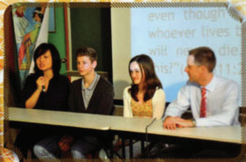
校園電視台為同學早會廣播 德國師生訪問