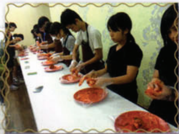
同學們製作韓國傳統文化食品—泡菜