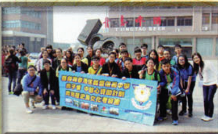
同學到青島啤酒廠參觀，了解中國國際企業走出去的情況