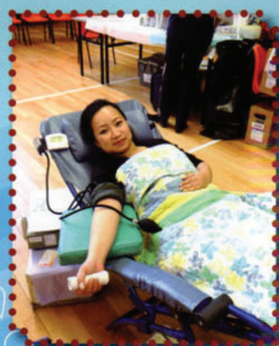
家長們身體力行支持捐血救人活動