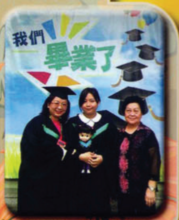
林太與其女兒一同畢業