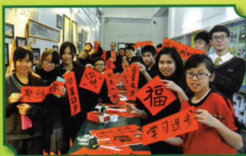
同學於中文周以書法學習中國傳統文化