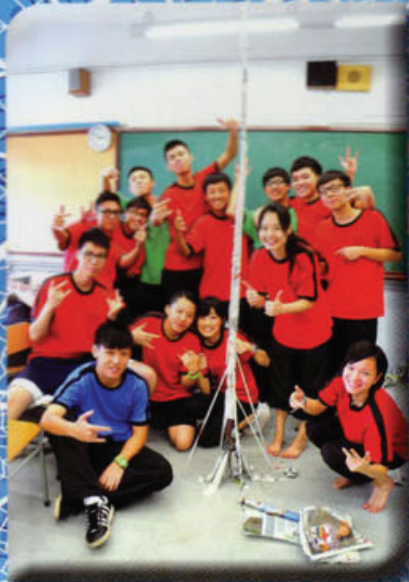
同學們於班主任課中進行 團隊協作活動