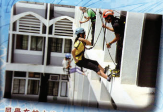
同學在校內進行游繩訓練，突破自己