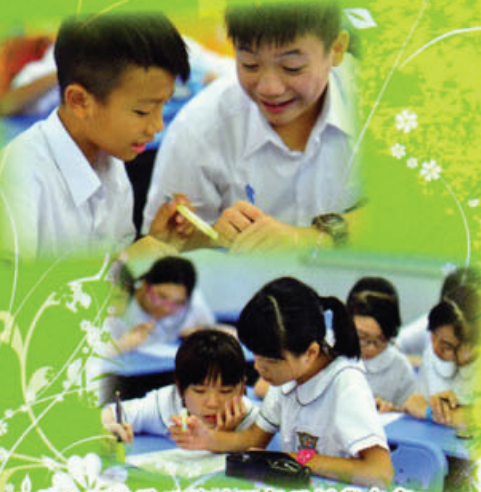
同學於學習鞏固節重溫每天所學內容