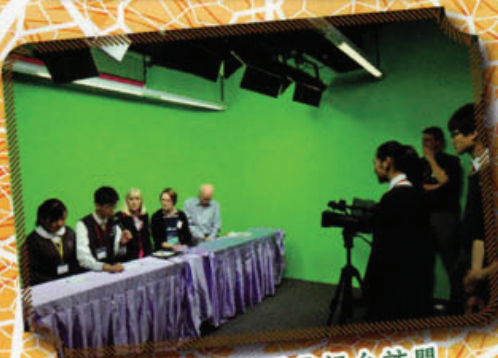
學生大使在校園電視台訪問 美國啟發潛能教育學者