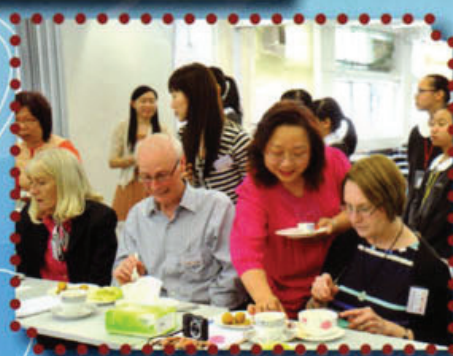
家教會代表與美國啟發潛能教育學家，分享如何在信義實踐家校合作