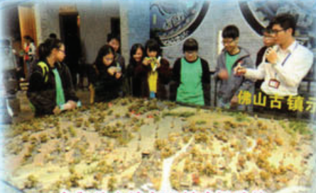
參觀佛山城市規劃建設展覽館