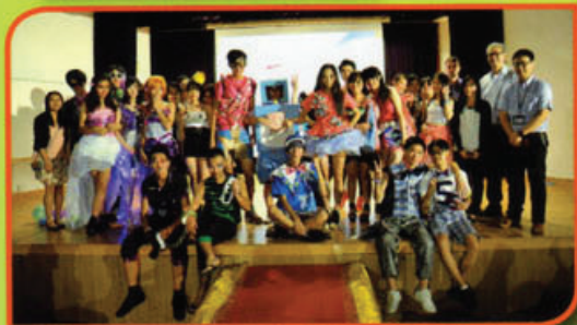
同學在環保時裝設計比賽，宣揚環境保護的訊息