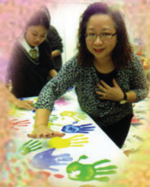
家教會在校慶晚會上製作 家教會主席協助學校舉行 小手工為同學籌得不少善款 55 周年校慶手印樹打手印

家教會參與及協助學校舉行 55 周年校慶活動，當中包括 55 周年校慶晚宴、「書友同行」步行籌款、綜藝晚會暨頒獎典禮、製作手印樹等。