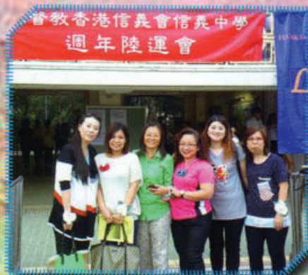
家教會成員一同出席 55 周年陸運會

第四十七屆陸運會於二零一三年十月十六日至十七日在深水埗運動場舉行。四社健兒於陸運會積極參與比賽，場內啦啦隊為健兒們歡呼打氣，場面一片熱鬧。