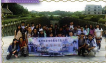
同學到韓國梨花女子大學參觀及交流