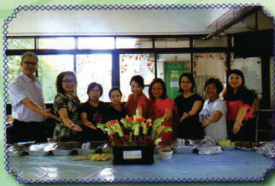
炎炎夏日家長們準備了冰凍生果為老師們打打氣