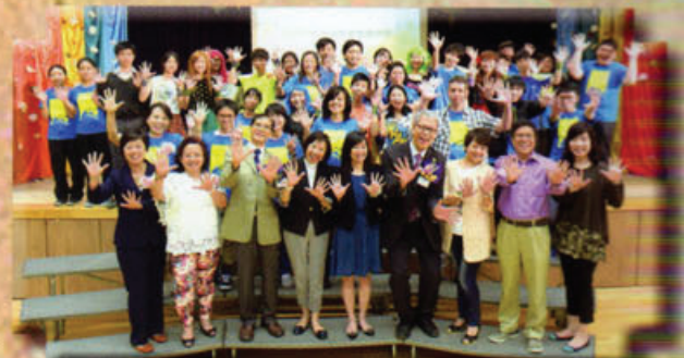
家教會代表出席 55 周年校慶綜藝晚會暨頒獎典禮