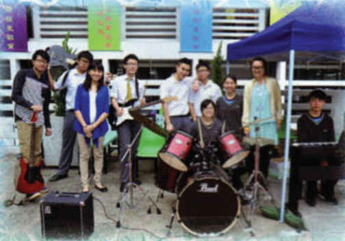
樂隊於午息時間以詩歌傳揚神的愛