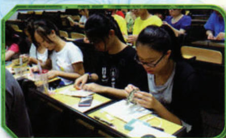
同學與當地學生一同製作中國傳統賀卡