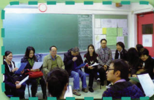
家長們與班主任在了解子女在校的情況

學校為了讓家長更了解同學的需要，每年均為各級學生安排家長晚會。家長除了能與班主任多作溝通外，更可在主題講座中了解孩子們學習的情況，如：中三升中四選科講座。