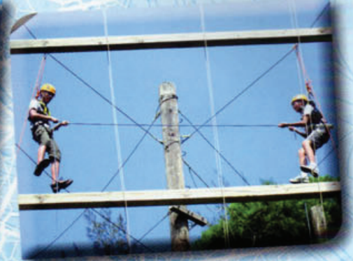
同學們進行歷奇訓練