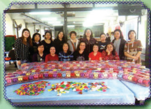
家長們齊心製作小手工為校慶及敬師作準備