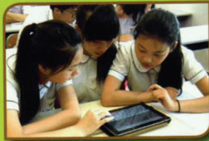
學生透過電子媒介自學英語