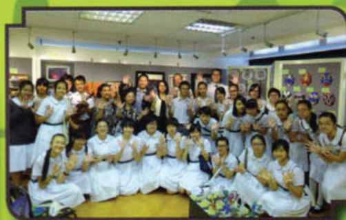
同學參與美術展的開幕儀式