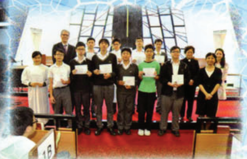
全校師生於真理堂參與復活節崇拜， 並頒發宗教之星同學獎項