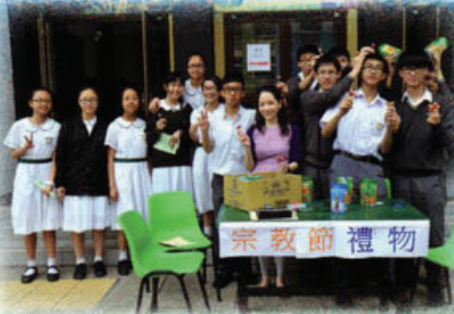
老師與學生共同參與宗教周活動