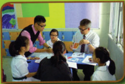
學生投入於數學堂上進行分組活動