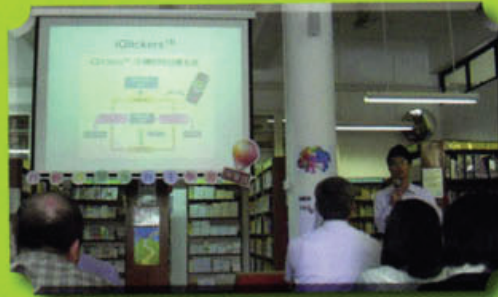
化學科老師分享透過 iQlickers 的系統啟發學生自學

學校英文科及通識教育科於 55 周年校慶公開課活動中，分享其行動學習的成果，當中學校更邀請了香港教育學院鄭志強博士為通識教育科公開課作觀課與評課的指導。而在 6 月 11 日學校亦舉行行動學習及自主學習分享日，各科老師分享為何想解決行動學習中的問題、有何計劃、評估能否對焦及如何解決所遇到的問題。