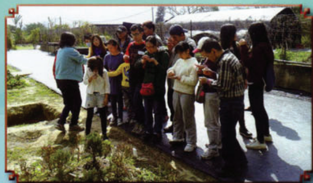
家長和學生們參與戶外郊遊活動—「一對手愛家庭之旅」