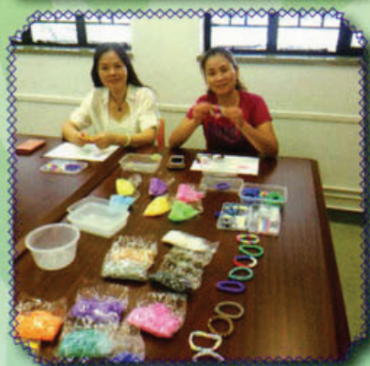
家長們用心製作的敬師小禮物

學校於二零一四年七月八日在學生中心舉行夏日聯歡活動，當中包括：由家長們主持的「家長也敬師活動」。家長們熱心地準備了美味食物和自製手繩送給老師們，在場氣氛熱鬧高興。