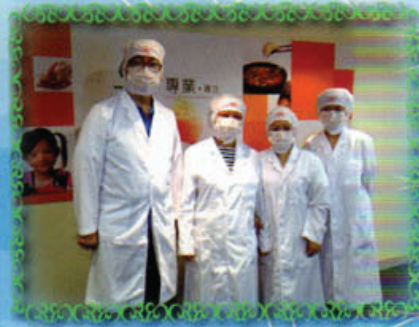
家長們到午膳供應商的廠房參觀